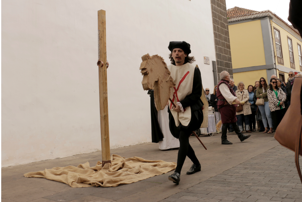
Imagen del Capítulo 1. La Picota